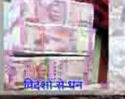
विदेशों से धन