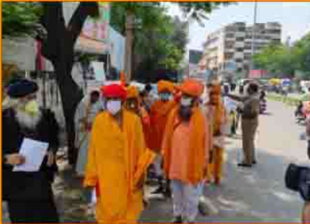
बीटीपी की जनजातीय समाज विरोधी गतिविधियों के विरोध में संत समाज ने उदयपुर जिलाधीश को ज्ञापन