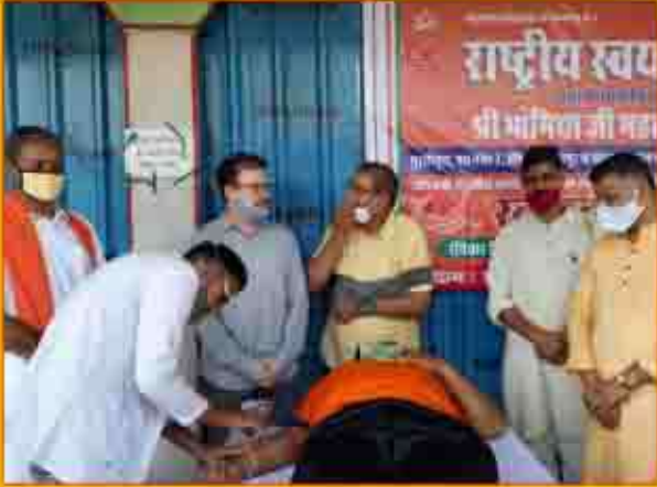
राष्ट्रीय स्वयंसेवक संघ सेवा विभाग द्वारा आयोजित रक्तदान शिविर