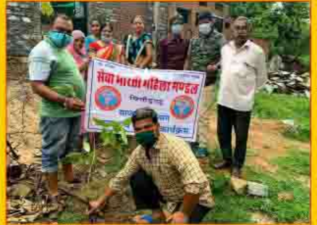
सेवा भारती चित्तौड़गढ़ के कार्यकर्ताओं द्वारा मोगर मगरी गांधी नगर बस्ती में पौधारोपण किया गया