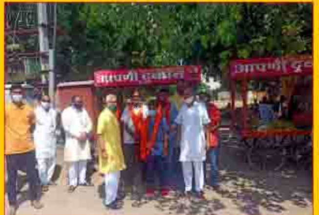
हिन्दू जागरण मंच के आर्थिक स्वावलम्बन योजना के तहत 'आपणी दुकान' का निरीक्षण करते हुए संघ के पदाधिकारी

स्वत्वाधिकारी पाथेय कण संस्थान के लिये प्रकाशक एवं मुद्रक माणक चन्द द्वारा कुमार एण्ड कम्पनी, २-10, 22 गोदाम औद्योगिक क्षेत्र, जयपुर से मुद्रित प्रकाशकीय कार्यालय: पाथेय धवन, 4, भारतीय संस्थानिक क्षेत्र, भारतीय नगर, जयपुर-302017 सम्पादक: मेघराज खत्री प्रेषण दिनांक 1,2,3,4 व 5 अक्टूबर 2020 आर.एम.एस.(पी.एस.ओ.) जयपुर