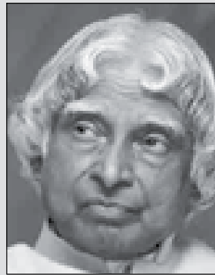
डा. अब्दुल कलाम

राष्ट्रपति बनने के कुछ दिन बाद वो किसी कार्यक्रम में शामिल होने केरल राज भवन, त्रिवेंद्रम गए। उनके पास अपनी तरफ से 'राष्ट्रपति के मेहमान' के रूप में किन्हीं दो लोगों को बुलाने का अधिकार था, और आप जान कर हैरान होंगे कि उन्होंने किसे बुलाया—एक मोची को और एक छोटे से होटल के मालिक को। दरअसल, डॉ. कलाम वैज्ञानिक के रूप में काफी समय त्रिवेन्द्रम में रहे थे, तभी से वे इन लोगों को जानते थे। किसी नेता या सेलेब्रिटी को बुलाने की बजाये उन्होंने इन आम लोगों को महत्व दिया।