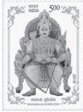
29 दिसम्बर, 2018 को जारी डाक टिकट

बारात आने लगी। ठीक उसी दिन हिंदूवादी संगठन महाराजा सुहेलदेव विजयोत्सव मनाते हैं। मध्यकाल में राष्ट्रभाव या कहें कि शत्रु-मित्र की पहचान इतनी तिरोहित होती गई कि एक आक्रमणकारी की मजार