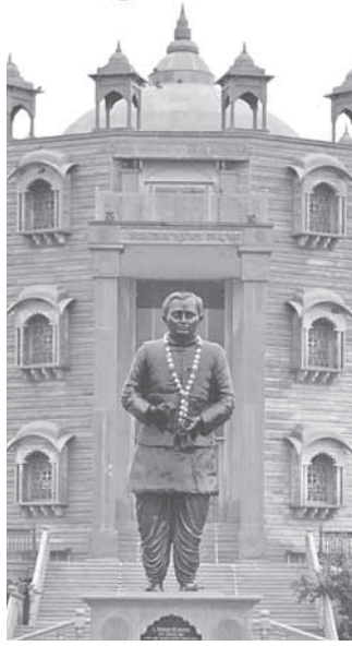
धानक्या स्थित पं.दीनदयाल स्मारक

विचारधाराओं से पूरा विश्व प्रभावित था। एक पूंजीवाद जिसका प्रतिनिधित्व अमेरिका करता था दूसरा साम्यवाद जिसका प्रतिनिधित्व रूस करता था। जब भारत स्वतंत्र हुआ तो